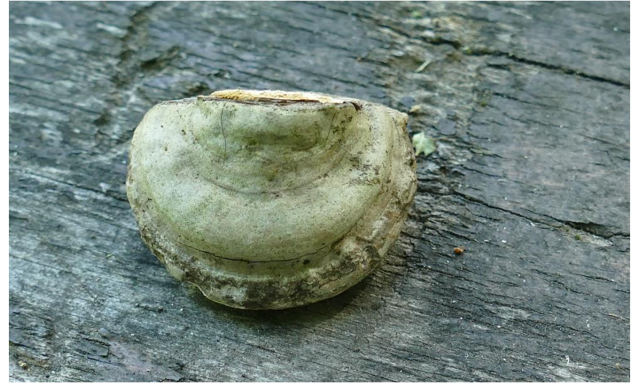
Amadouvier Fomes fomentarius