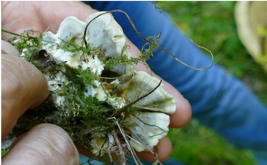
Bjerkandera adusta Polypore brûlé