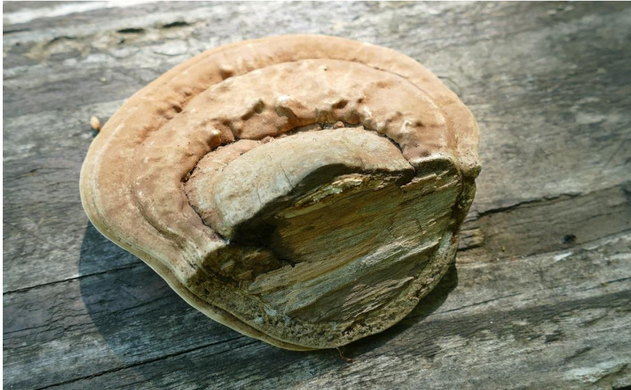
Ganoderme aplani Ganoderma lipsiense